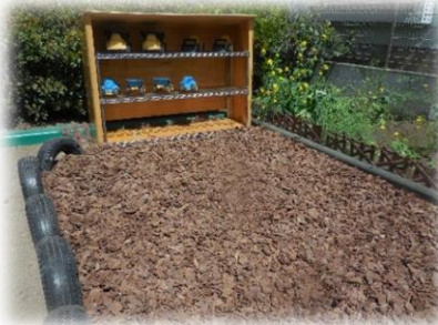
パークチップの上で車を使って工事ごっこ

保育園の園庭には下の写真のように遊べるようになっています。園児と一緒に同じ遊びを楽しんだり、自由に遊ぶことができます。ぜひ遊びに来てください！