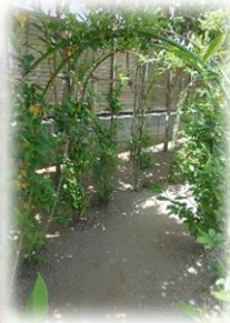
レンギョウの葉っぱのトンネルをくぐるよ