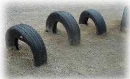
タイヤもあります