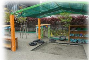
砂場では自由に玩具を出して使ってね