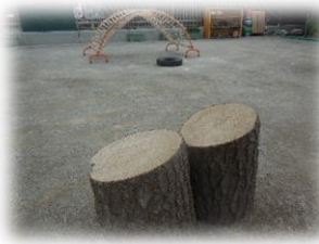
たくさん歩き回ったり、大きな切り株によじ登れるかな