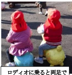
ロデオに乗ると両足で思い切り跳ねます