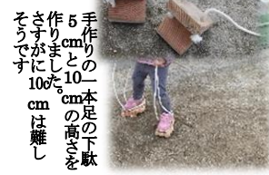
手作りの一本足の下駄 5cm、10cmの高さを さすりがましに10cmは難し そうだが、10cmは難し