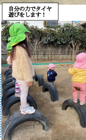
自分の力でタイヤ遊びをします!