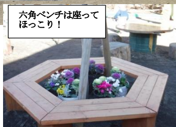
六角ベンチは座ってほっこり!