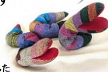
5歳児がさをり織機で織りました

謹んで新年のお慶びを申し上げます 昨年、園の運営にご理解、ご協力を賜りまことにありがとうございます 本年も何卒よろしくお願ひ申し上げます